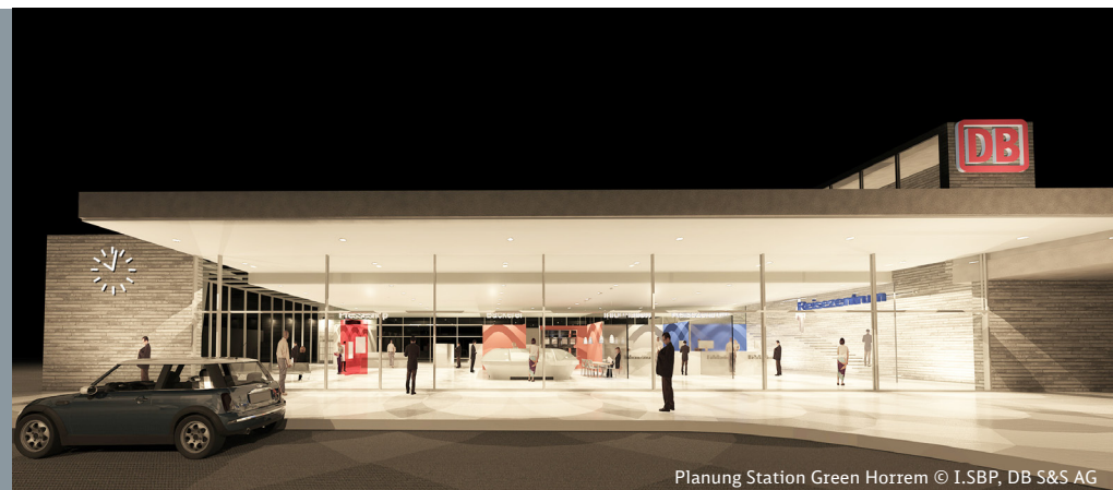
Planung Station Green Horrem