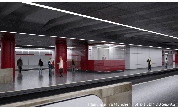
Planung uPva München Hbf