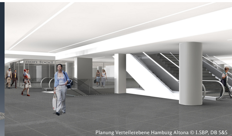
Planung Verteilerebene Hamburg Altona