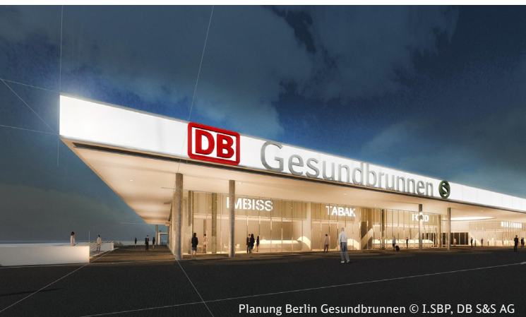
Planung Berlin Gesundbrunnen © I.SBP, DB S&S AG