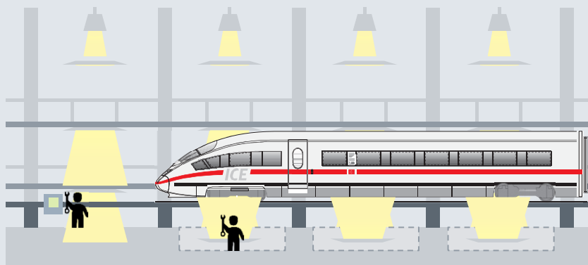
3) Mitarbeiter meldet sich am Gleis bzw. Fahrzeug an → Bodenplatte und Gleisgrube beleuchtet