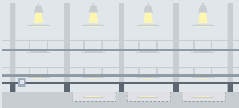
1) Gleis nicht belegt → nur Grundbeleuchtung durch Deckenstrahler