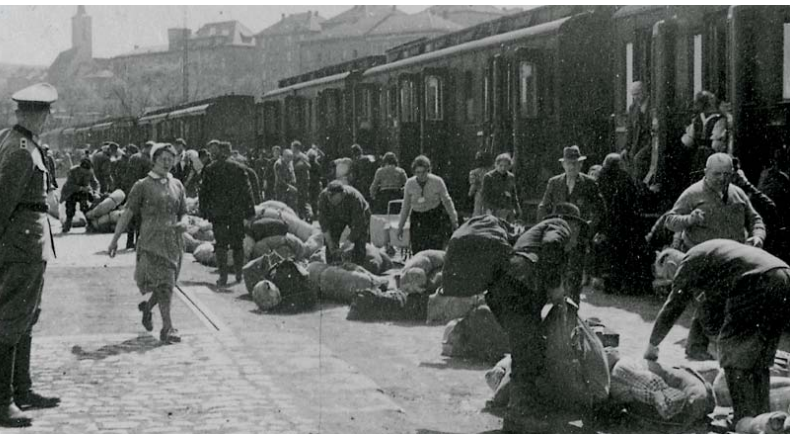
Déportation des Juifs de Mainfranken, Wurtzbourg en avril 1942