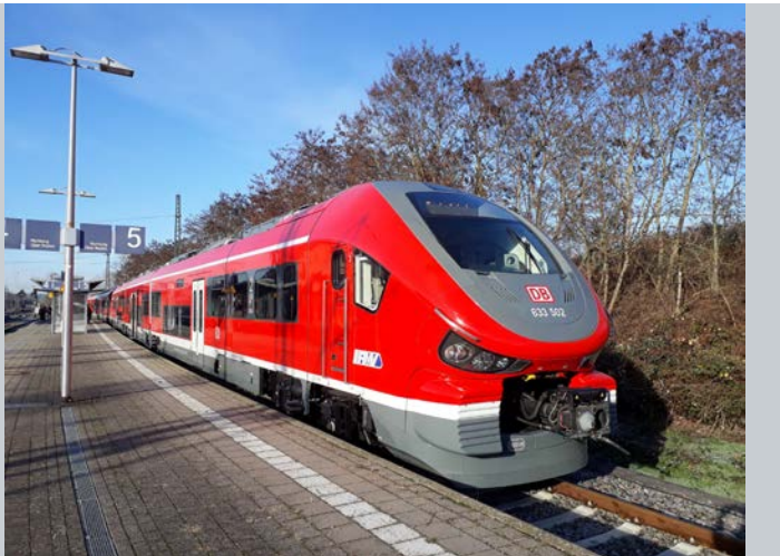
Ein PESA VT 633 auf der ersten Testfahrt über die Dreieichbahn

Bodenhöhe Hochflurbereich: 980 mm / 1290 mm