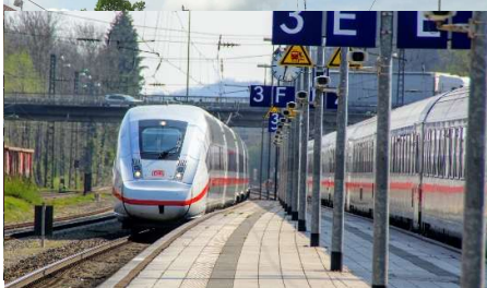
Ein ICE fährt in Günzburg ein

Josel: „Im Rahmen der Vorplanung wird die Deutsche Bahn untersuchen, mit welchen infrastrukturellen Lösungen die verkehrlichen Ziele optimal erreicht werden können.“