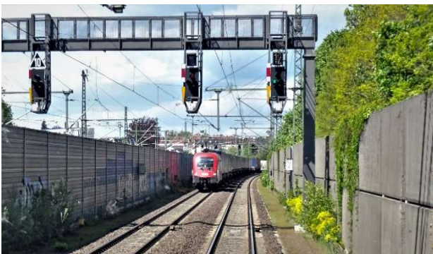
Schallschutzwände bei Neu-Ulm

Beim Aus- und Neubau der Bahnstrecke wird der Schutz der Anwohner von Anfang an berücksichtigt. Im Rahmen der gesetzlichen Lärmvorsorge kommen aktive und passive Schallschutzmaßnahmen zum Einsatz, beispielsweise in Form