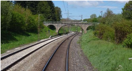
Bahnstrecke bei Burgau

Augsburg zu führen und eine weitere ICE-Linie über Stuttgart hinaus bis München zu verlängern.