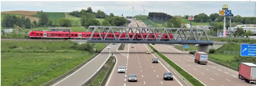
Der Fuggerexpress fährt über die Eisenbahnbrücke bei Burgau

(Ulm/Augsburg, im Oktober 2020) ICE-Züge, Intercity-Züge, Regionalverkehr und Güterzüge – sie alle benutzen heute die zweigleisige Strecke zwischen Ulm und Augsburg, die zentrale Verkehrsachse in Bayerisch Schwaben. Im Bundesverkehrswegeplan 2030 hat der Bund beschlossen, die Reisezeiten zu verkürzen, mehr Kapazität für Nah- und Fernverkehr zu schaffen und die Qualität zu steigern. Das beinhaltet verschiedene Varianten, von einem möglichen Ausbau der Bestandsstrecke bis zu einer eventuellen Neubaustrecke in bestimmten Abschnitten.